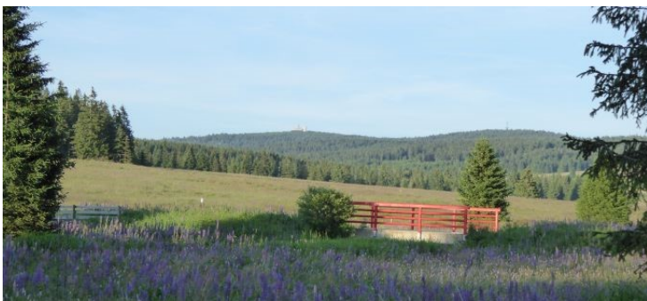
Blick zum Fichtelberg