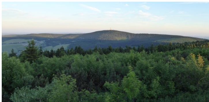
Blick vom Fichtelberg

40,00 € (Auch noch im Sonderbus zahlbar) / Unbedingt bis 02. Juli 2023 erforderlich!